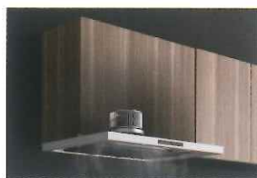
キープクリーンフード 10年間レンジフード内部のお手入れ不要