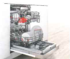
海外製食器洗機・ボッシュ 大容量フロントオープン食洗機