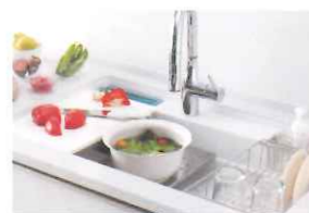
家事らくシンク 2層構造で効率よく、きれいに