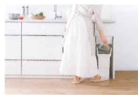
ホーローきれいエリア ゾーニングでゴミ捨てまでの作業を効率化