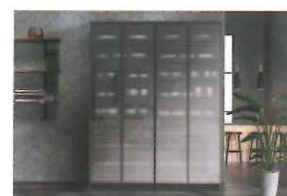
周辺収納・スタイリッシュ すっきりとしたデザインのスタイリッシュタイプ