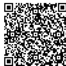
研修会申込フォーム